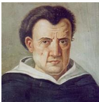
I licei "T. CAMPANELLA"